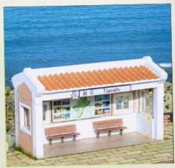
Tiaoshi Bus Station