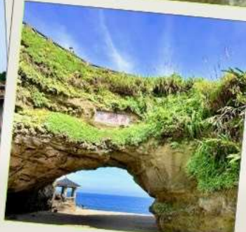
ถ้ำสี่เหมิน