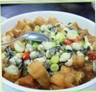
ถนนโบราณซือเฟิ่น