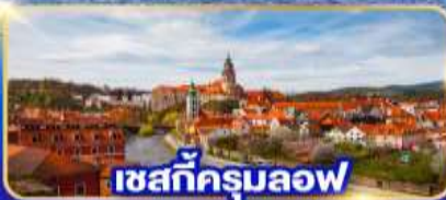
เซสท์ครุมลอฟ