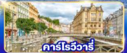
คาร์โรวัวร์