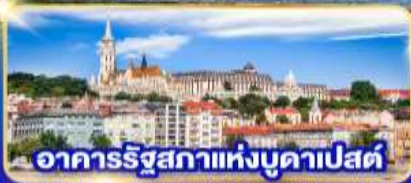
อาคารรัฐสภาแห่งบูดาเปสต์