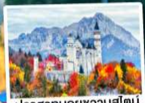
ปราสาทน้อยชวานสไตน์

09-15, 15-21 ต.ค. 68 23-29 ม.ค. / 25 ก.พ.-03 มี.ค. 69 06-12, 18-24 มี.ค. 69 01-07, 09-15, 10-16, 12-18 เม.ย. 69 29 เม.ย.-05 พ.ค. / 30 เม.ย.-06 พ.ค. 69 28 พ.ค.-03 มิ.ย. 69