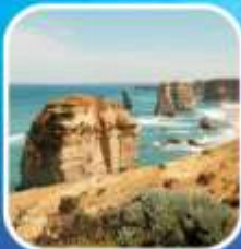
Great Ocean Road (ครึ่งสาย)