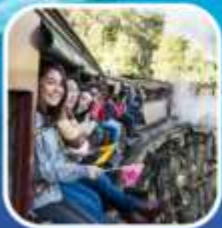
รถไฟจักรไอน้ำโบราณ