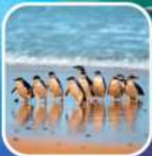
เพนกวินที่เกาะฟิลลิป