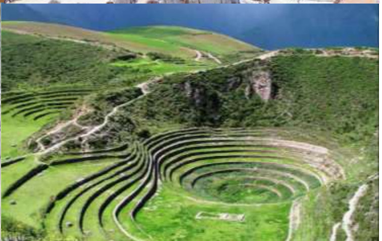
บ่าย นำท่านเดินทางสู่ มาราซ (Maras) แหล่งผลิตเกลือที่คุณภาพดีที่สุดในโลก ที่มีมาตั้งแต่สมัยอินคา แนวนาชั้นบันไดที่เรียงอยู่ตามลำดับความสูงของภูเขา จากนั้นเดินทางสู่ โมเรย์ (Moray) นาชั้นบนโดวงกลมขนาดใหญ่หลายวงรูปร่างแปลกตาที่ชาวอินคาทำไว้เพื่อทดลองปลูกพืชพันธุ์ต่างๆ จากจุดนี้สามารถมองเห็น หมู่บ้านอูรัมบัмба (Urubamba) ได้อีกด้วย ได้เวลาเดินทางกลับสู่เมือง เมืองคัสโก (Cusco) เมืองหลวงของอาณาจักรอินคา ที่แพร่ขยายอำนาจจนกินพื้นที่ 1 ใน 3 ของอเมริกาใต้ ตั้งอยู่เหนือระดับน้ำทะเลถึง 3,400 เมตร และเป็นแหล่งอารยธรรมยุคก่อนประวัติศาสตร์ที่ลึกลับน่าทึ่ง เป็นชุมชนเก่าแก่ของจักรวรรดิอินคาอันรุ่งเรือง ซึ่งยังคงทิ้งร่องรอยความเจริญไว้ให้เห็นเป็นซากปรักหักพังโบราณและโบราณวัตถุต่างๆ