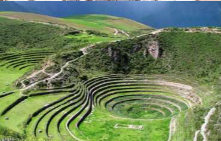
บ่าย นำท่านเดินทางสู่ มาราซ (Maras) แหล่งผลิตเกลือที่คุณภาพดีที่สุดในโลก ที่มีมาตั้งแต่สมัยอินคา แนวนาขั้นบันไดที่เรียงอยู่ตามลำดับความสูงของภูเขา จากนั้นเดินทางสู่ โมเรย์ (Moray) นาขั้นบันไดวงกลมขนาดใหญ่หลายวงรูปร่างแปลกตาที่ชาวอินคาทำไว้เพื่อทดลองปลูกพืชพันธุ์ต่างๆ จากจุดนี้สามารถมองเห็น หมู่บ้านอุรัมบัмба (Urubamba) ได้อีกด้วย ได้เวลาเดินทางกลับสู่เมือง เมืองคัสโก (Cusco) เมืองหลวงของอาณาจักรอินคา ที่แพร่ขยายอำนาจจนกินพื้นที่ 1 ใน 3 ของอเมริกาใต้ ตั้งอยู่เหนือระดับน้ำทะเลถึง 3,400 เมตร และเป็นแหล่งอารยธรรมยุคก่อนประวัติศาสตร์ที่ลึกลับน่าทึ่ง เป็นชุมชนเก่าแก่ของจักรวรรดิอินคาอันรุ่งเรือง ซึ่งยังคงทิ้งร่องรอยความเจริญไว้ให้เห็นเป็นซากปรักหักพังโบราณและโบราณวัตถุต่างๆ