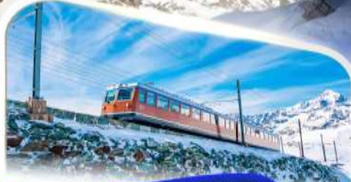
ขั้รถไฟฟันเฟืองก่อนนอร์แครง