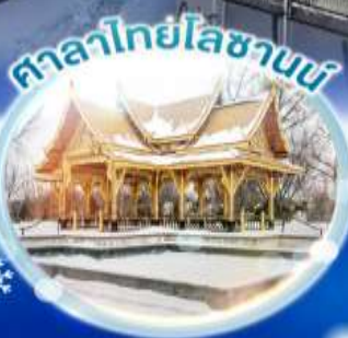
ศาลาไทยโลซานน์