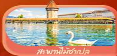
สะพานไม้ซังปก

Highlight เยือนหมู่บ้านแสนสวยเซอร์แมท เช็กอินศาลาไทยสุดงามที่โลซาน เกี่ยวลูเซิร์น ชมสะพานไม้ซังและอนุสาวรีย์สิงโต ซาลิ แอปสทิน ชมประติมากรรม The Fork และปราสาทซิลลองริมทะเลสาบ เยือนมิลาน มหาวิหารดูโอโม เที่ยวเวนิส เมืองลอยน้ำสุดโรแมนติก อินกับรักอมตะที่บ้านจูเลียต และช้อปปิ้งจุใจที่ Serravalle Outlet