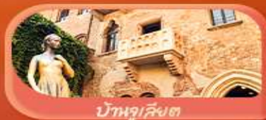
บ้านจูเลียต