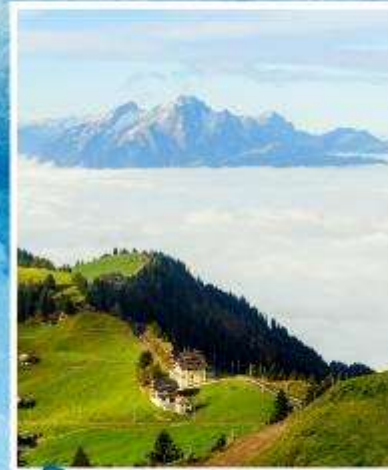
RIGI KULM Queen of the Mountains