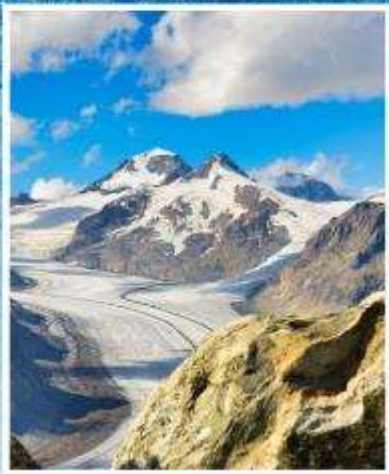
ALETCH GLACIER Riederalp, Bettmeralp

แกรนด์สวิตเซอร์แลนด์ 9 วัน พักหมู่บ้านเชอร์แมท