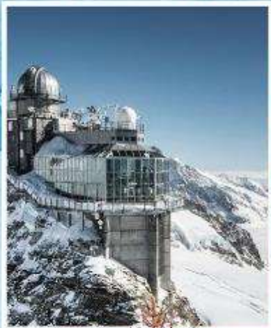
JUNGFRAUJOCH "Top of Europe"