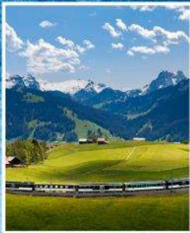
GOLDEN PASS LINE Montreux-Zweisimmen