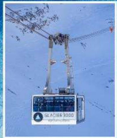
GLACIER3000 Peak walk by Tissot