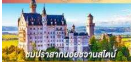
ชมปราสาทนอยชวานสไตน์