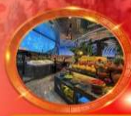
บุฟเฟต์หมีโพล่งซิ่ง