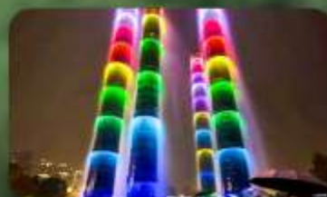
น้ำพุไม้ไฟ