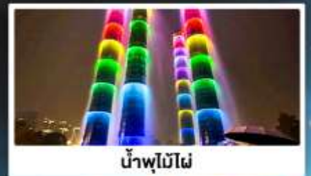
น้ำพุไม้ไฟ