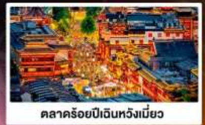
ตลาดร้อยปีเงินหวงเมี่ยว