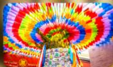
วัดลามะกว้างเหริน