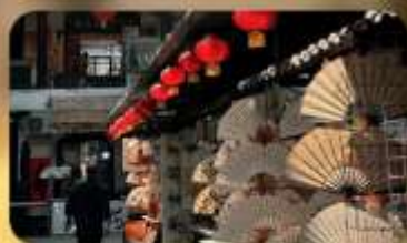
ถนนโบราณซูเหยี่ยนเหมิน