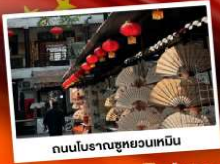
ถนนโบราณซูหยวนเหมิน