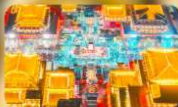
ถนนวัฒนธรรมต้าถิง