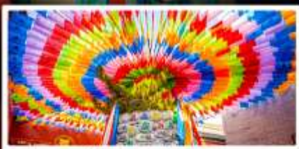
วัดลามะกว้างเหิน