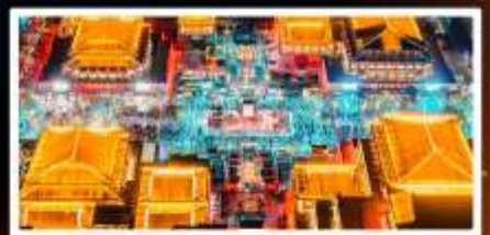
ถนนวัฒนธรรมต้าถิง