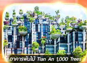
อาคารพันไม้ Tian An 1,000 Trees