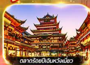
ตลาดร้อยปีเงินหวงเหมียว

เที่ยวดิสนีย์แลนด์เต็มวัน (รวมบัตร + รถรับส่ง) ช้อปปิ้งย่านดัง, นานกิง, เจินหวงเหมียว