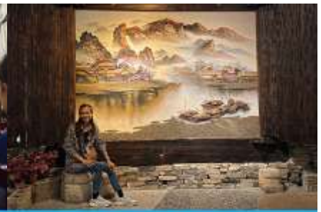
พิพิธภัณฑ์ภาพเขียนหินทราย