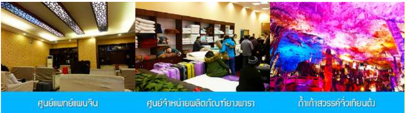
ศูนย์แพทย์แผนจีน

อัตราค่าบริการสำหรับโปรแกรมเสริมการแสดงชุด The love Story of Wooden man and Fairy Fox ท่านละ 400 หยวน (หรือประมาณ 2000.-บาทขึ้นอยู่กับอัตราแลกเปลี่ยน) ระยะเวลาที่ใช้ในการเที่ยวชมการแสดง ประมาณ 3 ชั่วโมง รวมเวลา เดินทางไป กลับค่าบริการรวม ค่าบัตรเข้าชม ค่ารถรับ ส่ง และค่าน้ำดื่มของไกด์ท้องถิ่น