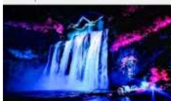
อุทยานน้ำตกหวงทิวชู่