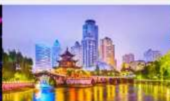
หอเจียเซียวไหลว