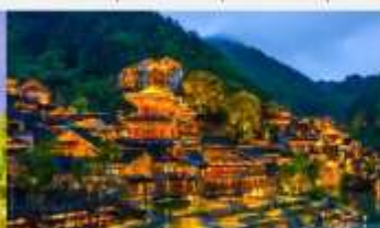
หมู่บ้านโบราณวูเจียงจ้าย