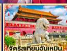
จักรุสเทียนอันเหมิน