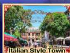
Italian Style Town