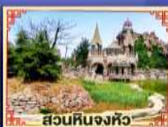
สวนหินงิ้วหวู่