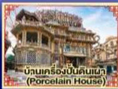
บ้านเครื่องปั้นดินเผา (Porcelain House)

มีพิเศษ.. เปิดปักกิ่ง, บึงย่างกาหลี่, สุกี้ Haidilao