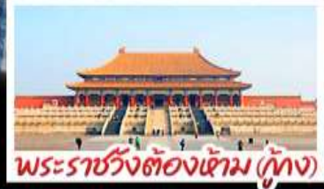
พระราชวังต้องห้าม (ทุ่ง)