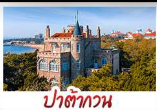
ป่าตึกวน

พระราชวังฤดูร้อน - วิวเมืองซิงเต่า รถไฟความเร็วสูง - ภูเขาเหลาซาน กำแพงเมืองจีนด้านจวียงกวน - ป่าตึกวน พักโรงแรมระดับ 4 ดาว - ไม่ลงร้านซื้อ มื้อพิเศษ เปิดปักกิ่ง , หม้อไฟซีฟู้ด