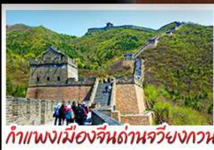
กำแพงเมืองจีนด้านจวียงกวน