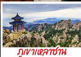
ภูเขาเหลาซาน