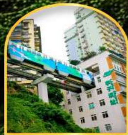
สถานีรถไฟ-ลูคัก

02-06, 10-14, 16-20, 18-22, 23-27, 24-28 มี.ค. 69 06-10, 11-15, 14-18, 21-25, 24-28 เม.ย. 69 02-06, 05-09, 09-13, 12-16, 19-23, 21-25 พ.ค. 69 29 พ.ค. -02 มิ.ย. 69 01-05, 02-06, 09-13, 19-23, 23-27 มิ.ย. 69