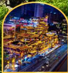
ตลาดหงหยาดัง