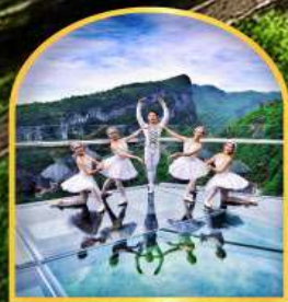
ระเบียบงิ้วอุหลอง