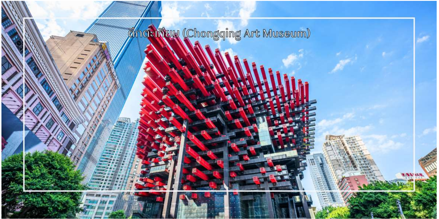
ตึกตะเกียบ (Chongqing Art Museum)

จากนั้นนำท่านชม ตึกไควชิงโหล (Kuaiqinglou) 22 ชั้น ตึกสุดแปลกเดินจากชั้น 1 กลายเป็นชั้นที่ 22 แลนด์มาร์กสำคัญที่ตั้งตระหง่านอยู่ใจกลางเมืองฉงชิ่ง โดดเด่นด้วยสถาปัตยกรรมสูงส่งที่ผสมผสานความทันสมัยเข้ากับเสน่ห์ของวัฒนธรรมท้องถิ่นอย่างลงตัว จากชั้นบนสุดของตึกสูง 22 ชั้นแห่งนี้ ท่านจะได้ชมทัศนียภาพแบบพาโนรามา 360 องศา ทั้งแม่น้ำแยงซีที่ทอดยาวคดโค้งและภาพเมืองฉงชิ่ง จากนั้นแวะถ่ายรูปและสัมผัสความสวยงามของ ตึกตะเกียบ (Chongqing Art Museum) แลนด์มาร์กสุดแปลกตาใจกลางเมือง ที่ออกแบบอาคารให้มีลักษณะคล้ายตะเกียบ ยักษ์สีแดง-ดำซ้อนกันอย่างโดดเด่น อาคารแห่งนี้เป็นที่ศูนย์จัดแสดงศิลปะร่วมสมัยและจุดถ่ายภาพยอดนิยมของนักท่องเที่ยว ด้วยดีไซน์ทันสมัยและเอกลักษณ์เฉพาะตัว ทำให้ที่นี่กลายเป็นหนึ่งในสถานที่ที่ต้องมาเยือน