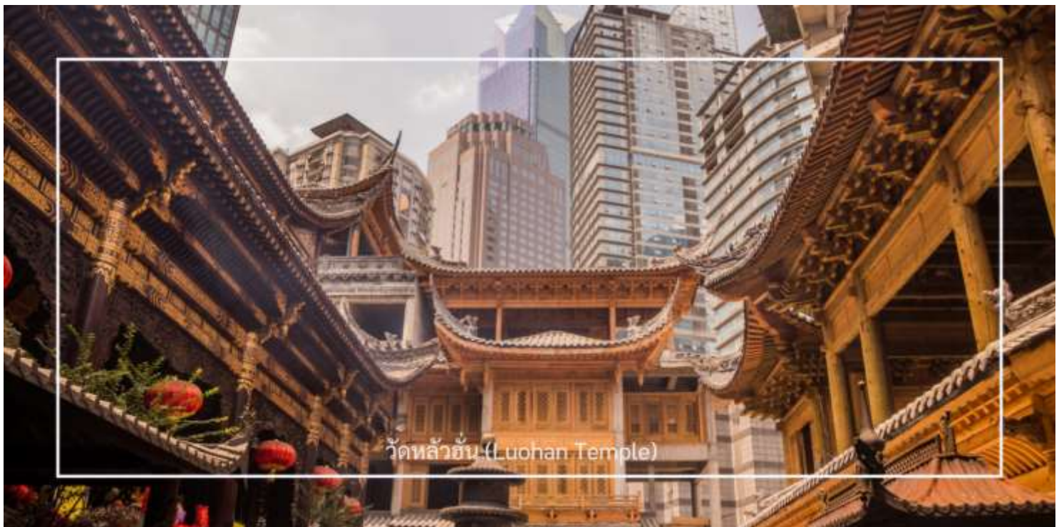
วัดหลัวฮั่น (Luohan Temple)

นำท่านเที่ยวชม วัดหลัวฮั่น (Luohan Temple) หรือที่เรียกว่า "วัดอรหันต์" เป็นวัดที่มีชื่อเสียงในเมืองฉงชิ่ง มีประวัติศาสตร์ยาวนานและมีความสำคัญในด้านศาสนาพุทธ วัดหลัวฮั่นมีพระพุทธรูปและรูปปั้นอรหันต์จำนวนมาก ซึ่งเป็นที่เคารพนับถือของผู้มาเยือน นอกจากนี้ยังมีบริเวณที่ให้ผู้เข้าชมสามารถทำบุญและสวดมนต์