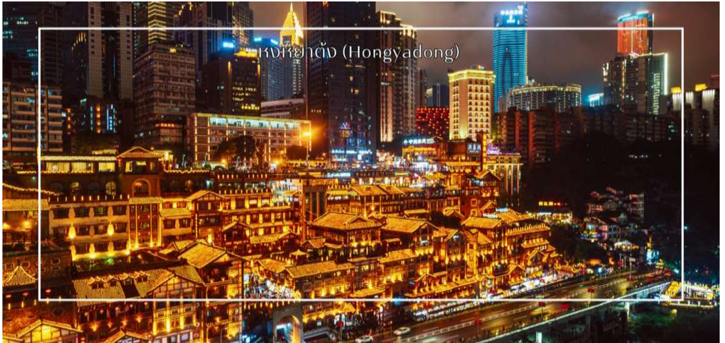
หงหยาดัง (Hongyadong)

ร้านอาหาร และบาร์จำนวนมาก ที่นี่ท่านสามารถลิ้มลองอาหารรสเด็ดและชมพื้นเมืองอื่นๆที่ขึ้นชื่อ ตลาดหงหยาดัง ยังมีวิวทิวทัศน์ที่สวยงาม สามารถเดินเล่นตามทางเดินที่มีการจัดแสดงงานศิลปะและสินค้าท้องถิ่น