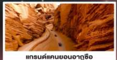
แกรนด์แคนยอนอาถูซื่อ