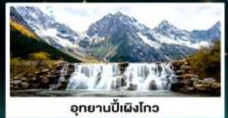
อุทยานปี้เฉิงโกว