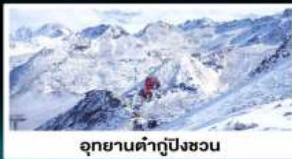
อุทยานคำกู่ปิงชอน