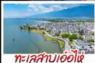
ทะเลสาบเอ๋อไห่