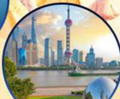
นอร์ทบิ้น กรีนแลนด์