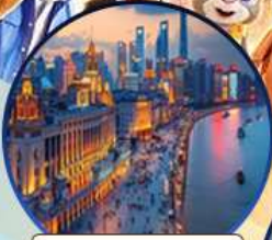
หาดไวทาน