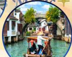
เมืองโบราณจูเจียเจีย