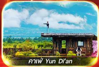
กาแฟ Yun Di'an

นั่งรถไฟขบวน "ภูเขาหิมะมังกรหยก", ชมสวนดอกไม้ตามฤดูกาล ชมโชว์สุดอลังการ IMPRESSION LIJIANG, ถ่ายรูปกับคาเฟ่ยอดฮิต