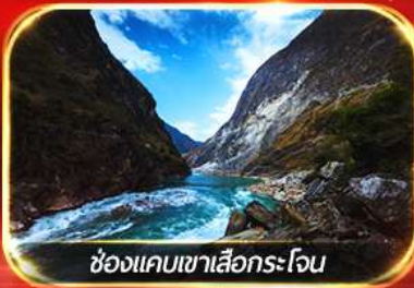
ช่องแคบเขาเสือกระโจน