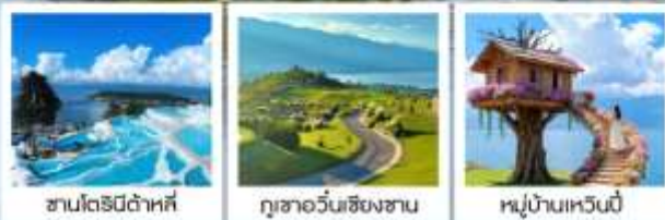
ซานโตรินี่ต้าหลี่

“เกาะเสี้ยวฉู...เกาะลึกลับกลางทะเลสาบ เอ้อไห่”