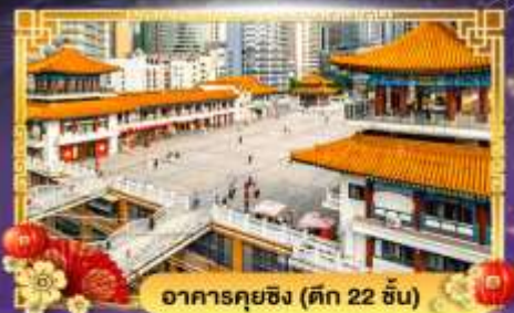
อาคารคุยซิง (ตึก 22 ชั้น)