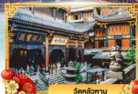
วัดหลิวทาน