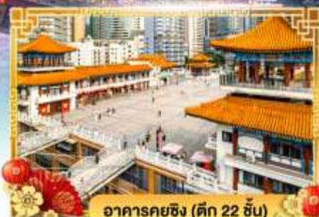
อาคารคุยฉิง (ตึก 22 ชั้น)