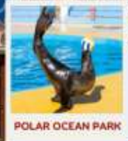
POLAR OCEAN PARK