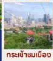
กระบี่เข้าขมเมือง