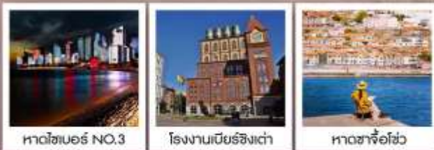
หาดไซเบอร์ NO.3

ซิมฟรี!! ...เบียร์ชิงเต่า สูตรออริจินัลดั้งเดิม ...ท่านละ 1 แก้ว