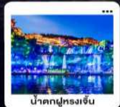
น้ำตกฟูหลงเจิน

"มหัศจรรย์...จางเจียเจีย" | ดินแดนแห่งขุนเขาและสายน้ำ "เขาเทียนเหมินซาน" | ประตูสวรรค์...ทำท่ายศรึกษา 999 ชั้น | บั้งรถไฟความเร็วสูง สัมผัสความสวยงามระเบียบงั่ว "อุทยานอวตาร" | ส่องล่องกลางขุนเขา...ดั่งภาพฝันในห้วงนเจียเจีย | ช้อปปิ้ง POPMART "เมืองโบราณ" ฟูหลง หยุตเวลา ณ เมืองบนบ้านน้ำตก... | "เฟิ่งหวง" ส่องเรือชมชีวิตริมแม่น้ำถิวเจียง "นครฉางซา" ปิดท้ายความทันสมัย