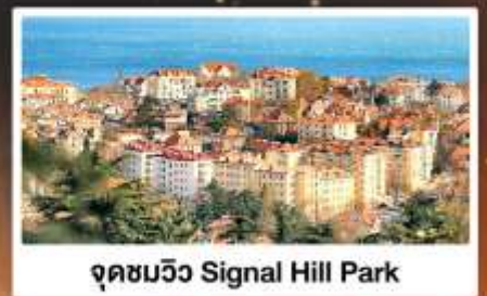
จุดชมวิว Signal Hill Park