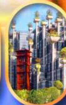
อาคาร 1,000 คับไม้