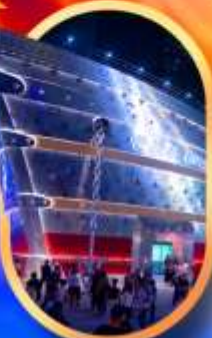
เรือเดอะหลุยส์