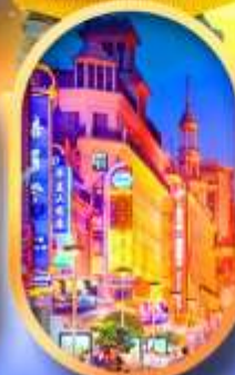
ถนนหนานกิง