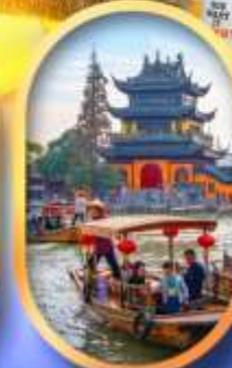
เมืองโบราณจู่เจียเจียว