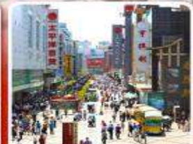
ช้อปปิ้งถนนคนเดินชุนซีลู่