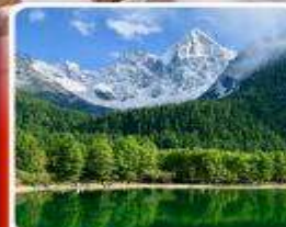
อุทยานπίงเิงโกว