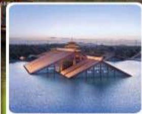
พิพิธภัณฑ์ไต้หน้ำ กวงฟูหลิน