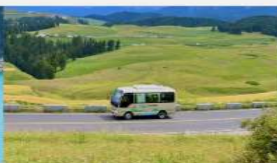
ทุ่งหญ้าเจียนปูลาเค่อ