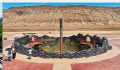
ภูเขาเปลวเพลิง

*ทางบริษัทฯ ขอสงวนสิทธิ์ในการส่งโปรแกรมทัวร์ตามความเหมาะสมขึ้นอยู่กับสถานการณ์ปัจจุบัน โดยคำนึงถึงผลประโยชน์ของลูกค้าเป็นสำคัญ