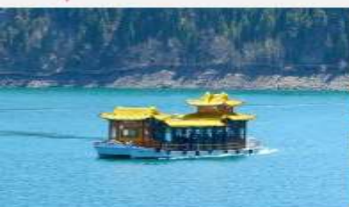
ล่องเรือทะเลสาบเกียนฉือ