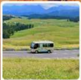
ทุ่งหญ้าเจียนปูลาเค่อ