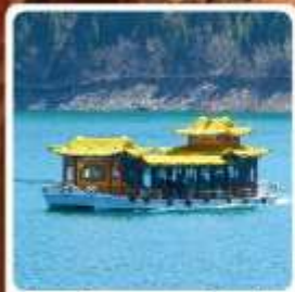
ล่องเรือทะเลสาบกีเยนจื่อ