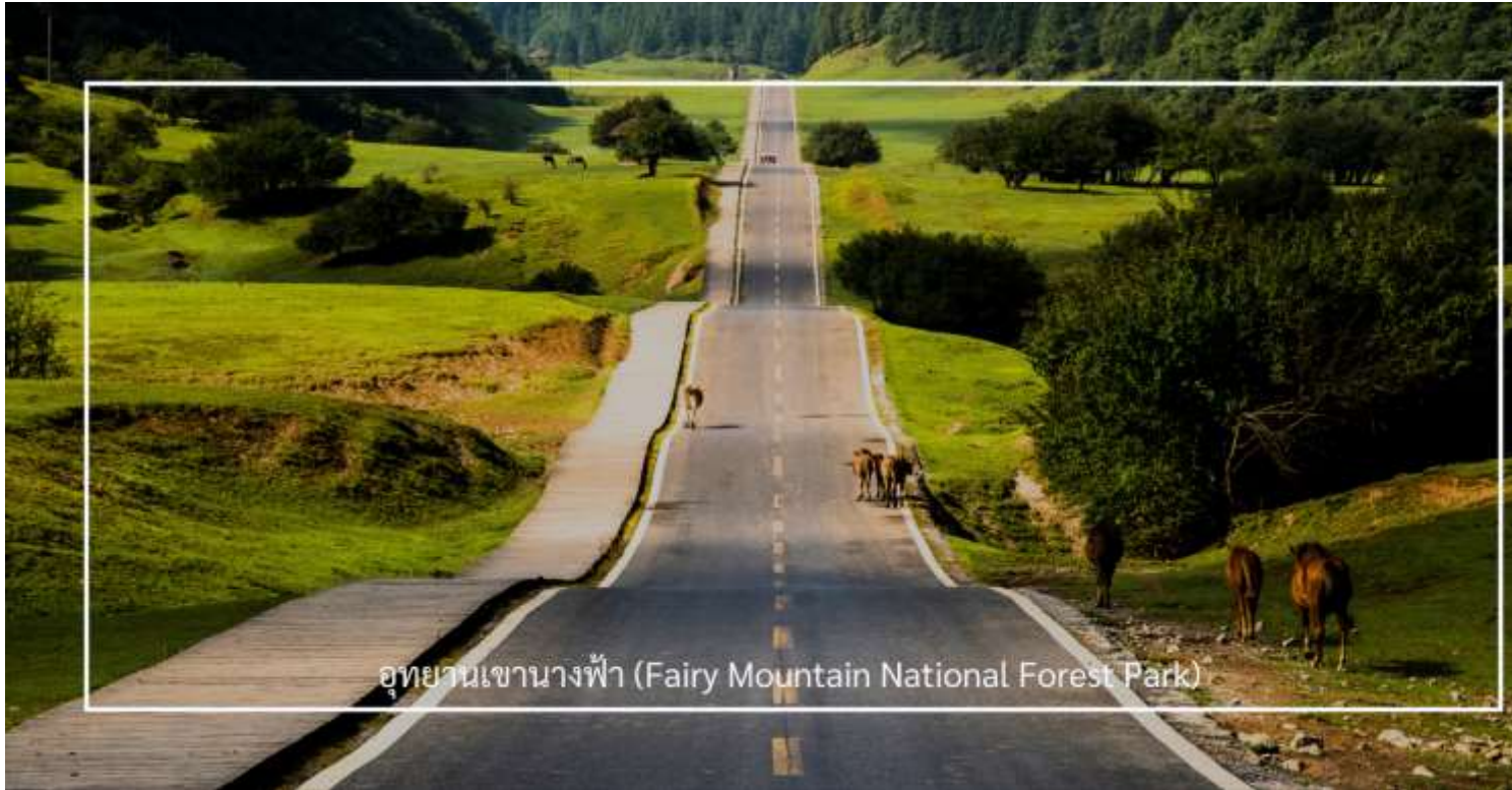
อุทยานเขานางฟ้า (Fairy Mountain National Forest Park)

โดดเด่นด้วยภูมิประเทศแบบที่ราบสูงอัลไพน์ ครอบคลุมพื้นที่กว่า 330 ตารางกิโลเมตร มีความสูงเฉลี่ยกว่า 2,000 เมตรจากระดับน้ำทะเล อุดมสมบูรณ์ไปด้วยทุ่งหญ้ากว้าง ป่าไม้เขียวขจี และยอดเขาสลับซับซ้อน งดงามราวภาพวาด พร้อมอากาศเย็นสบายตลอดทั้งปี นักท่องเที่ยวสามารถนั่ง รถไฟขบวนเล็ก ชมวิวธรรมชาติรอบอุทยานฯ ได้อย่างสะดวกสบาย เพลิดเพลินทั้งฤดูร้อนที่สดชื่นและฤดูหนาวที่ปกคลุมด้วยหิมะขาวโพลน