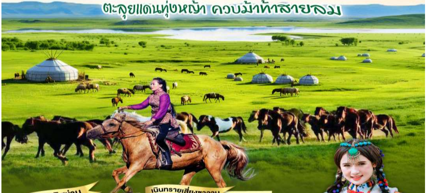
สุสานเจงกิสข่าน