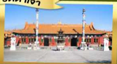
วัดต้าเจา