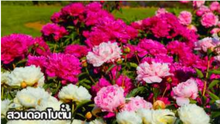
สวนดอกโบตั๋น

เดือนสิงหาคม-ต้นกันยายน ชมทุ่งดอกเบญจมาศหรือดอกไฮเดรนเยีย ดอกเบญจมาศปักกิ่งหมายถึงสายพันธุ์เบญจมาศที่มีต้นกำเนิดหรือนิยมปลูกในกรุงปักกิ่ง ประเทศจีน โดยเฉพาะช่วงฤดูใบไม้ร่วง ที่มีการจัดงานมหกรรมดอกเบญจมาศ แสดงความหลากหลายของสีและรูปร่าง มีสายพันธุ์เช่น "กุสุยจินเสี่ย" ที่ได้รับรางวัลราชาดอกเบญจมาศ และยังมีเบญจมาศปักกิ่งสีขาวที่เป็นสมุนไพรด้วย ที่สำคัญคือเป็นดอกไม้ที่ใช้ในงานเทศกาลและวัฒนธรรม โดยเฉพาะในสวนสาธารณะ เช่น รือถาน และอุทยานเป่ย์ไห่ มีหลากหลายสี เช่น ขาว เหลือง ชมพู แดง และม่วง สามารถพบได้ในหลายพื้นที่