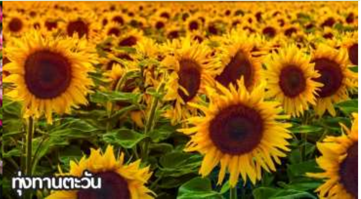
ทุ่งทานตะวัน

จากนั้นนำท่านสู่ ถนนหวังฝูจิ่ง ถนนคนเดินสุดฮิตใจกลางกรุงปักกิ่ง ปัจจุบันถนนนี้เป็นที่นิยมมากในหมู่นักช้อปปิ้งและนักท่องเที่ยวที่ตบเท้าเข้ามาเพื่อเสาะหาของลดราคาและเสื้อผ้าที่มีเอกลักษณ์ไม่ซ้ำใคร ถนนการค้าที่พลุกพล่านแห่งนี้มีร้าน บาร์ ร้านอาหาร และคาเฟ่เรียงรายตลอดทางอยู่บนถนนคนเดินสายนี้ ให้ท่านได้ช้อปปิ้งร้าน Pop Mart ที่ใหญ่ที่สุดในปักกิ่งตุ๊กตา box หน้าตาน่ารักที่ดังที่สุดในจีนตอนนี้ ต้องยกให้กับ Pop Mart