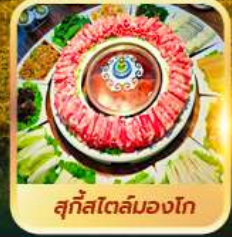
สุกีสโตลมองโก