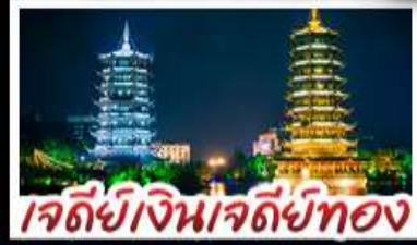
เจตีย์เงินเจตีย์ทอง

หมู่บ้านแม้วซีเจียง - จั๋งจายโกวน้อย - เสียวซีโซว เมืองโบราณเขยฮือ+ล่องเรือ - เจตีย์เงินเจตีย์ทองวิวก้า เขางวงช้าง - สะพานแดงหรือ - รถไฟความเร็วสูง ไม่ลงร้านช้อปปิ้ง - เมมูพิเศษ บุฟเฟ่ต์ชาบูซีฟู้ด ปลายทางเมืองเพื่อคริสตัส สุกี้หัด