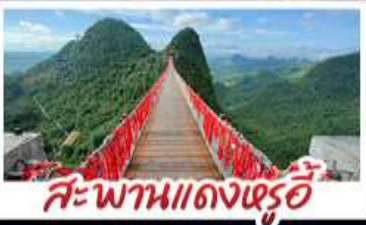
สะพานแดงหรือ