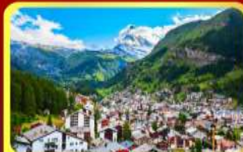
เชอร์แมน