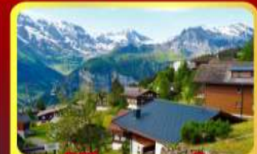
หมู่บ้านเมอร์เซน