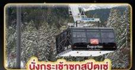
นั่งกระเช้าชุกสปีตซ์