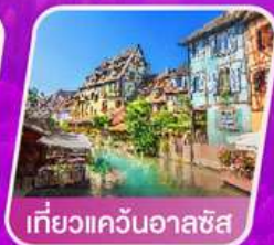
เที่ยวแคว้นออลซัส