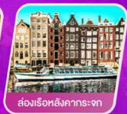
ส่องเรือสิงคารถะจก