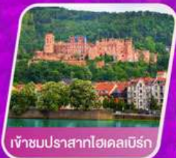
เข้าชมปราสาทไฮเดลเบิร์ก

โรงแรม 4 ดาว | อาหาร 14 มื้อ | โทคิน่า เทียว | 1 ใบ 23 กก.