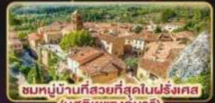
ชมหมู่บ้านที่สวยงามที่สุดในฝรั่งเศส (มูสดีเยแซงมาร์)