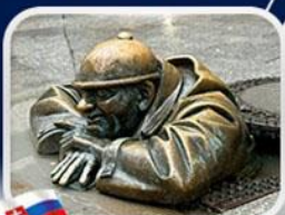
ประติมากรรม Cumil

มาเรียนพลาทซ์ • บ้านเกิดโมสาร์ท • พระราชวังฮอฟบวร์ก • ซาลส์บวร์ก • บ้านเกิดโมสาร์ท • เกรโกเดรสตรีก • ทะเลสาบคอนิกซ์ • หมู่บ้านอัลส์สตัดท์ • อนุสาวรีย์มาเรียเทเรซา