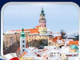
เมืองเซสกี คุลมลอฟ