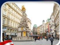
ช้อปปิ้งคาร์ทเนอร์สตรีก