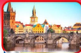
เขื่อนอินสะพานชาร์ลส์