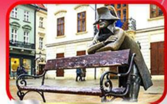
ย่านเมืองเก่าปราทิสลาวา

เที่ยวเมืองสวยริมทะเลสาบ ฮัลล์สตัดท์ • ชมเมืองไข่มุกแห่งโบฮีเมีย เซสกี กรุงลอน • ปราท • เวียนนา • ซอปปิงพาร์นดอร์ฟ เอาก์เล็ท