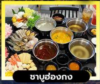
ซาบู่ฮองกง