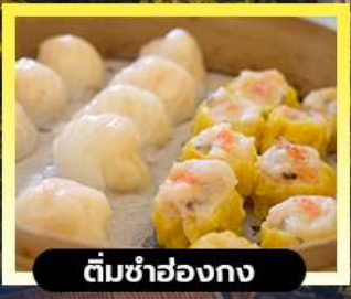
ตีมซ่าฮองกง